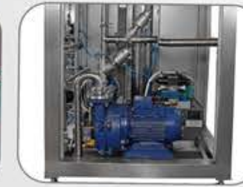
نظام فاكيوم Vacuum System