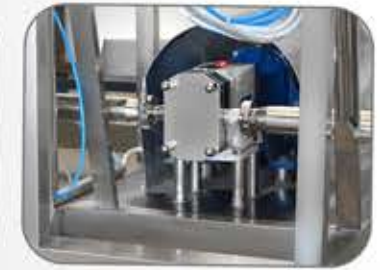
أنواع متعددة من المضخات Pumps with various types