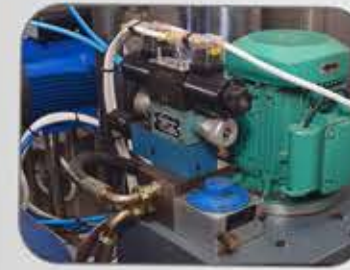
نظام هيدروليكي Hydraulic System