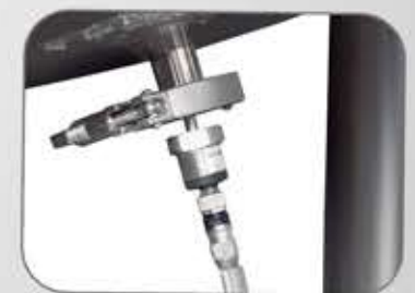
حساسات (حرارة، ضغط، مستوى...) مصنوعة من الشركات الأوروبية الرائدة Stat-of-the art instruments from European leaders suppliers