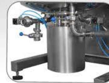
تصاميم واستطاعات متعددة للمجانس Multiple designs and capacities for homogenizer